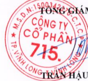
TRẦN HẬU NINH