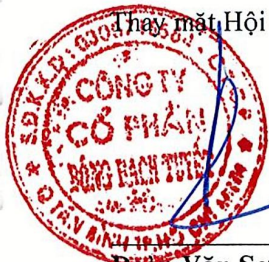
Đoàn Văn Sơn Chủ tịch