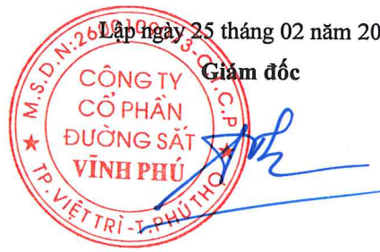
Trần Như Thắng