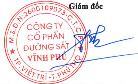
Trần Như Thắng