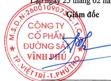
Trần Như Thắng