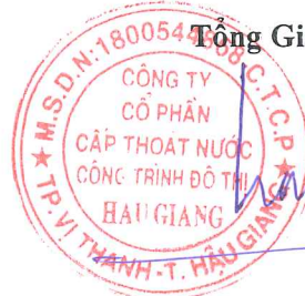
BÙI TRỌNG LỰC