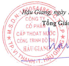
BÙI TRỌNG LỰC