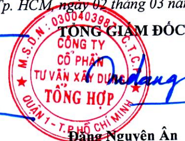
Đặng Nguyên Ân