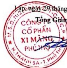
Trần Tuấn Đạt