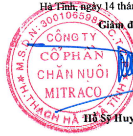
Hồ Sỹ Huy Tháo