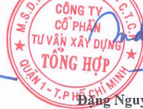
Đặng Nguyên Ân