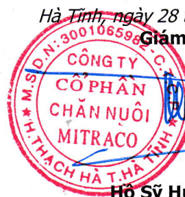
Hồ Sỹ Huy Thảo