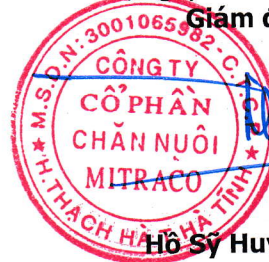
Hồ Sỹ Huy Thảo