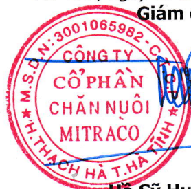
Hồ Sỹ Huy Thảo