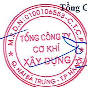
Đào Đức Thọ