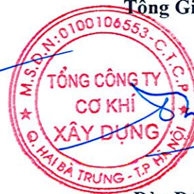
Đào Đức Thọ