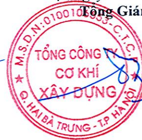
Đào Đức Thọ