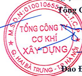
Đào Đức Thọ