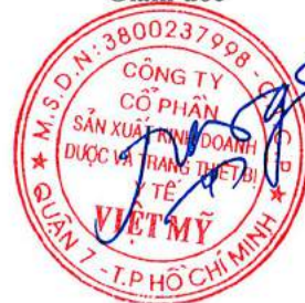
Đặng Nhị Nương