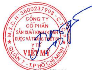
Đặng Nhị Nương