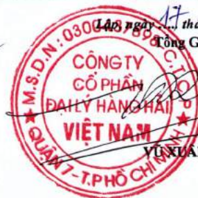
VÕ TRUNG THẮNG