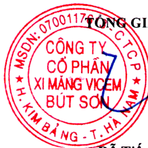
Đỗ Tiên Trình