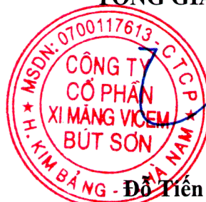
Đỗ Tiên Trinh