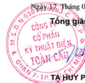
TÀ HUY PHONG