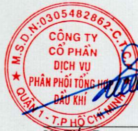
Vũ Tiến Dương Chủ tịch hội đồng quản trị