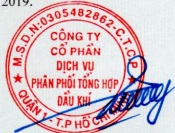
Vũ Tiên Dương Chủ tịch hội đồng quản trị