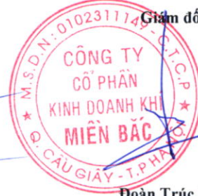
Đoàn Trúc Lâm