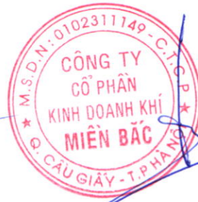
Đoàn Trúc Lâm