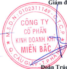
Đoàn Trúc Lâm