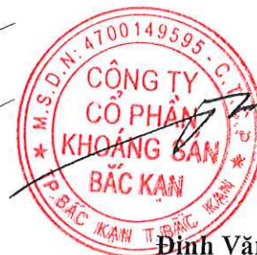
Đình Văn Hiến