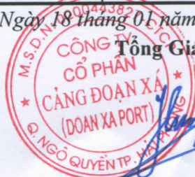
Trần Việt Hùng