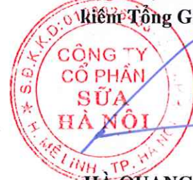
HÀ QUANG TUẤN