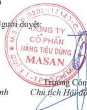
Trương Công Thắng Chủ tịch Hội đồng Quản trị