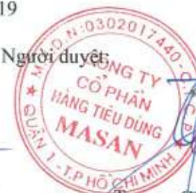
Trương Công Thắng Chủ tịch Hội đồng Quản trị

Các thuyết minh đính kèm là bộ phận hợp thành của báo cáo tài chính riêng này