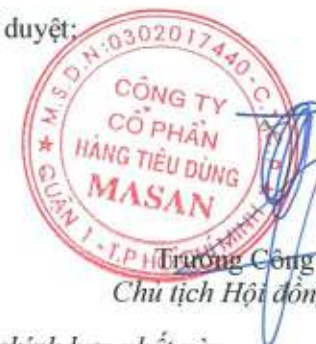
Trương Công Thăng Chủ tịch Hội đồng Quản trị

Các thuyết minh đính kèm là bộ phận hợp thành của báo cáo tài chính hợp nhất này