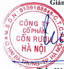
Trần Hậu Cường