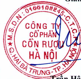
Trần Hậu Cường