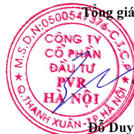
Đỗ Duy Điền