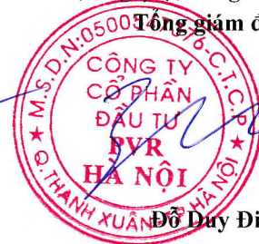
Đỗ Duy Điền