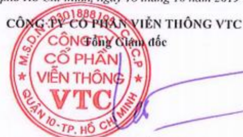
Lê Xuân Tiến

Các thuyết minh từ trang 7 đến trang 29 là bộ phận hợp thành của Báo cáo tài chính này.