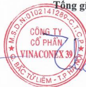
Vũ Thành Kiên