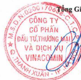
ĐỖ ĐỨC TRỊNH