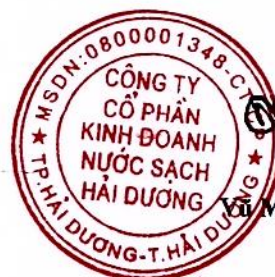
Yỗ Mạnh Dũng

(Các thuyết minh từ trang 6 đến trang 28 là bộ phận hợp thành của Báo cáo tài chính giữa niên độ này)