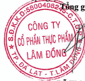
Đỗ Thành Trung