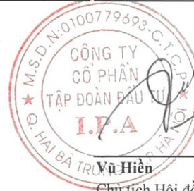
Yữ Hiền Chủ tịch Hội đồng quản trị Hà Nội, ngày 30 tháng 10 năm 2019