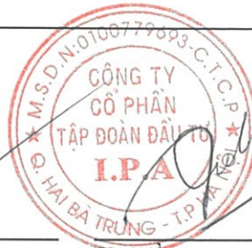
Vũ Hiền Chủ tịch Hội đồng quản trị Hà Nội, ngày 30 tháng 10 năm 2019