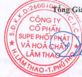
Phạm Quang Tuyền

(Các thuyết minh từ trang 10 đến trang 35 là bộ phận hợp thành của Báo cáo tài chính tổng hợp này)