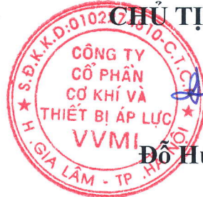
Đỗ Huy Hùng