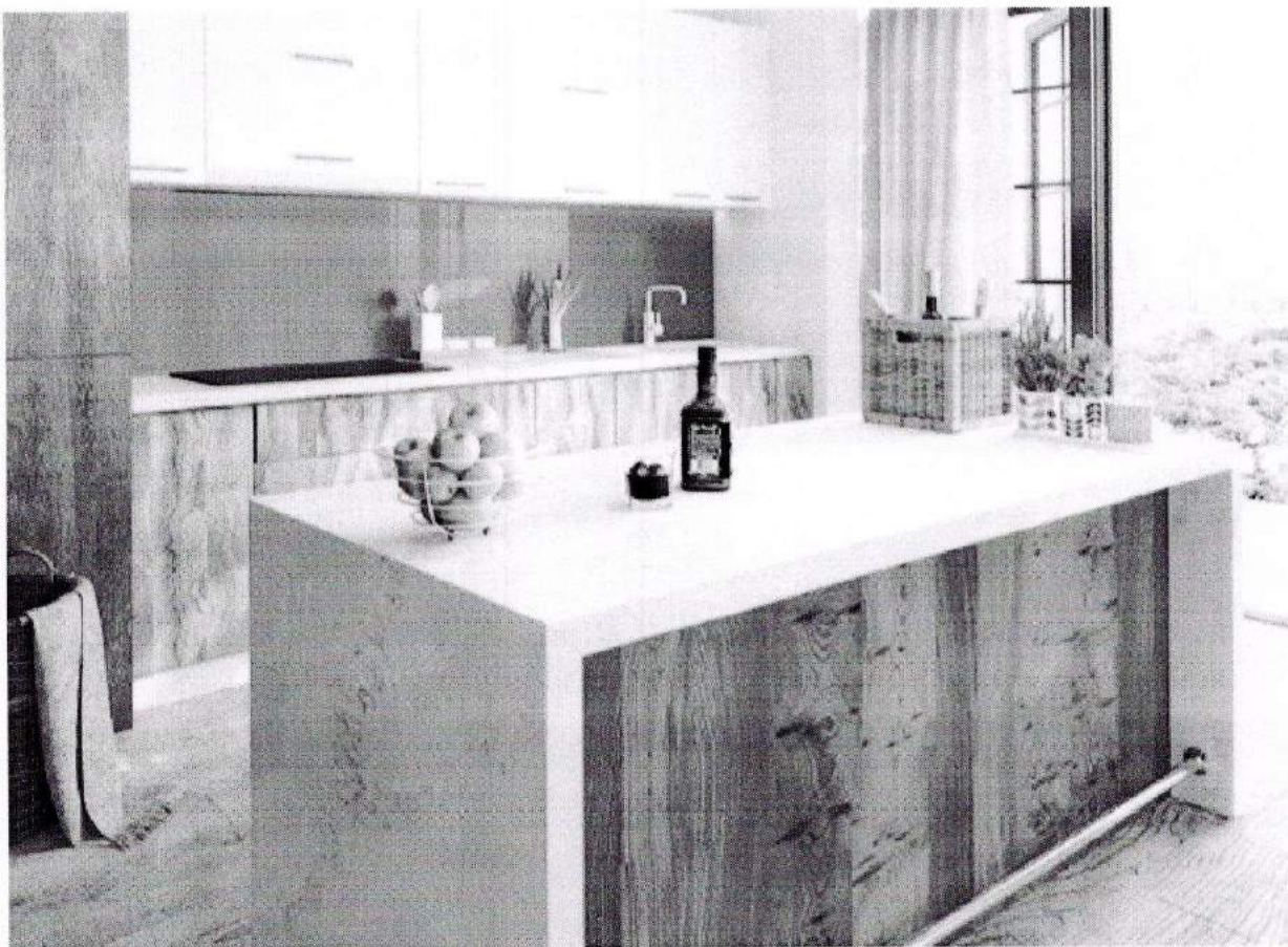
Đường nét tinh xảo