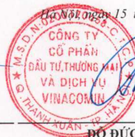
ĐỖ ĐỨC TRỊNH