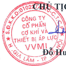
Đỗ Huy Hùng