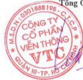
LÊ XUÂN TIÊN