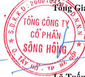
Lã Tuấn Hưng