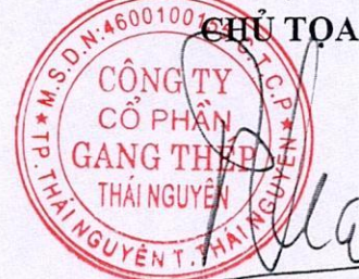
Đinh Quốc Thái