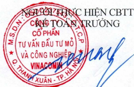
Phùng Đức Trường