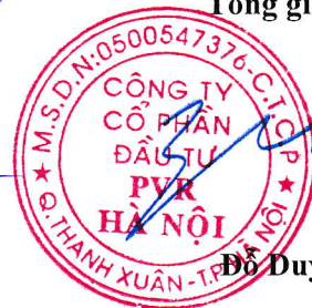
Đỗ Duy Điền