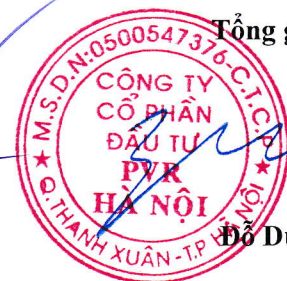
Đỗ Duy Điền