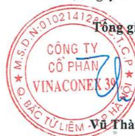
Vũ Thành Kiên