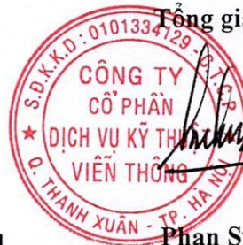
Phan Sỹ Kiên

Chứng chỉ ISO 9001:2008 (được cấp bởi TUV-NORD ngày 10/04/2014).