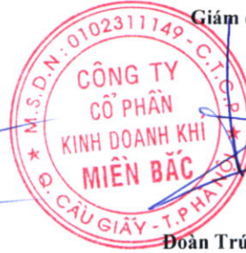
Đoàn Trúc Lâm