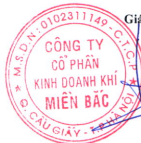
Đoàn Trúc Lâm