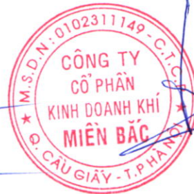
Đoàn Trúc Lâm