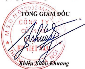
Khiêu Xuân Khương