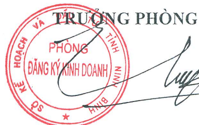
Nguyễn Xuân Thủy