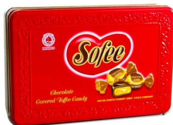
Kẹo hộp SOFEE