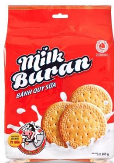
Bánh quy sữa Buran