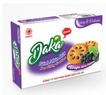
Bánh hộp nhân mứt Daka