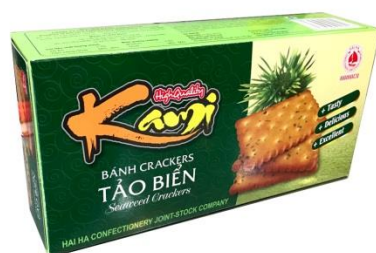
Bánh táo biển Kami