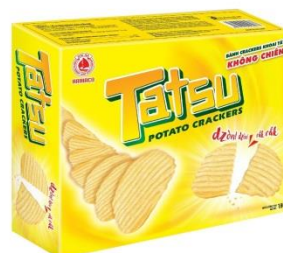
Bánh khoai tây Tatsu