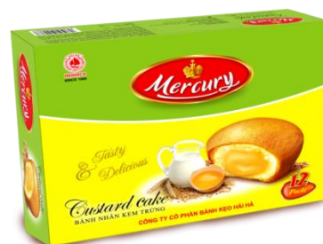
Bánh Trứng Mercury