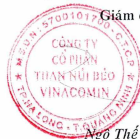
Ngô Thế Phiệt