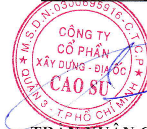
TRẦN XUÂN CHƯỜNG