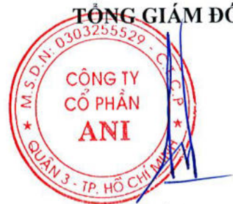
Đặng Tất Thành