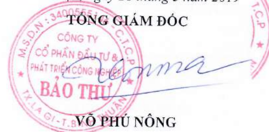
VÕ PHÚ NÔNG