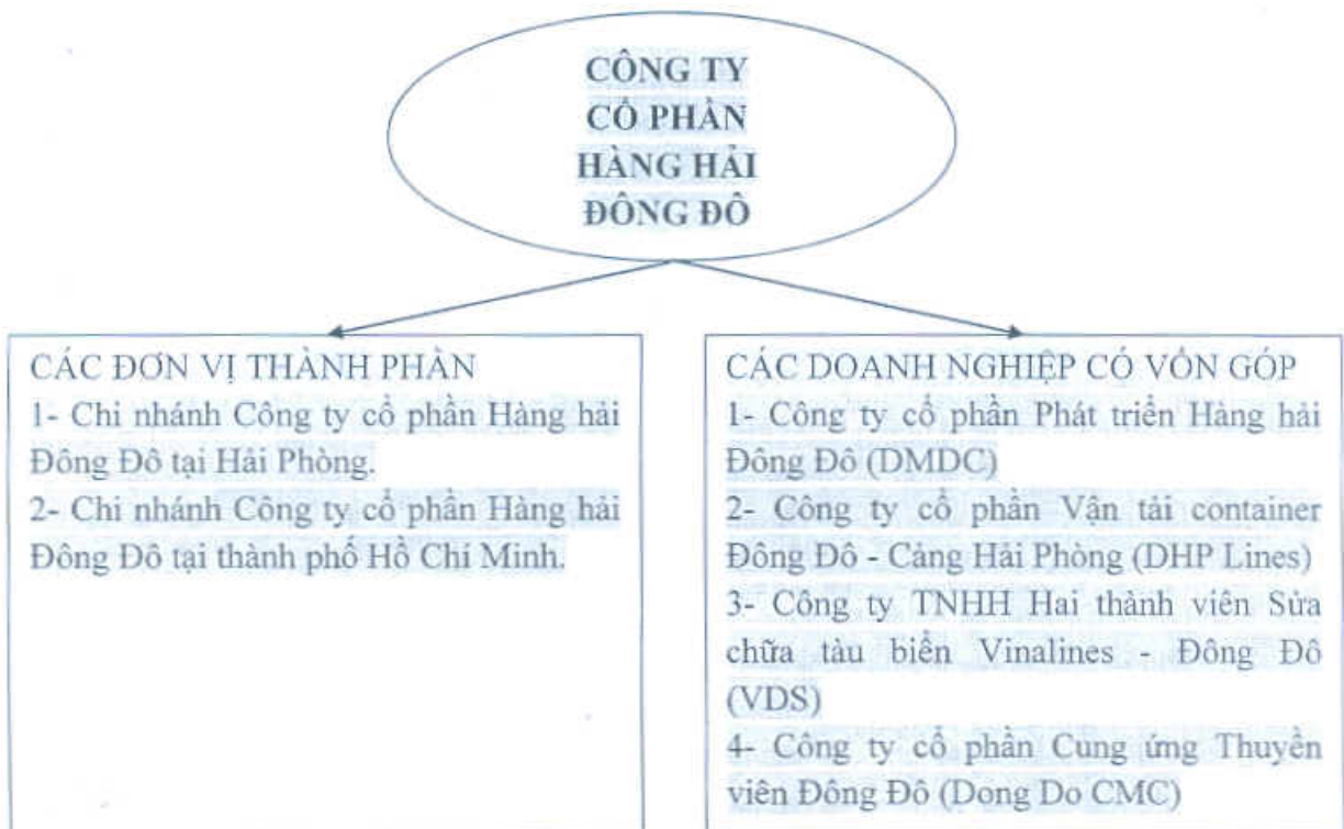
Hình 1 - Cơ cấu tổ chức Công ty cổ phần Hàng hải Đông Đô

Vốn điều lệ: 2,5 tỷ đồng, trong đó Công ty cổ phần Hàng hải Đông Đô góp 1,8 tỷ đồng tương ứng 72% vốn điều lệ.